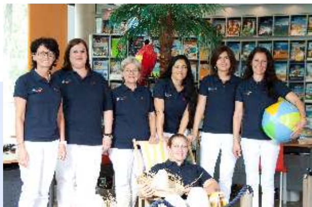
Die Urlaubsmacherinnen vom Volksbank Reisebüro

Haben Sie Lust auf eine Premium Alles Inklusive Kreuzfahrt mit TUI Mein Schiff bekommen? Dann sind Sie im Volksbank Reisebüro genau richtig. Vereinbaren Sie unter der (0 72 43) 94 74 - 88 88 doch einfach einen Termin.