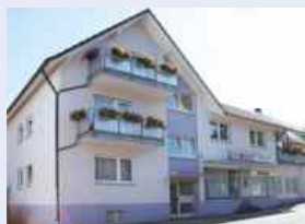
Bad Herrenalb Wohnen und arbeiten in einem Haus , Wfl. 127 m 2 , Laden- und Nutzfläche ca. 137 m 2 , gute Lage, solider Zustand, € 249.000,--