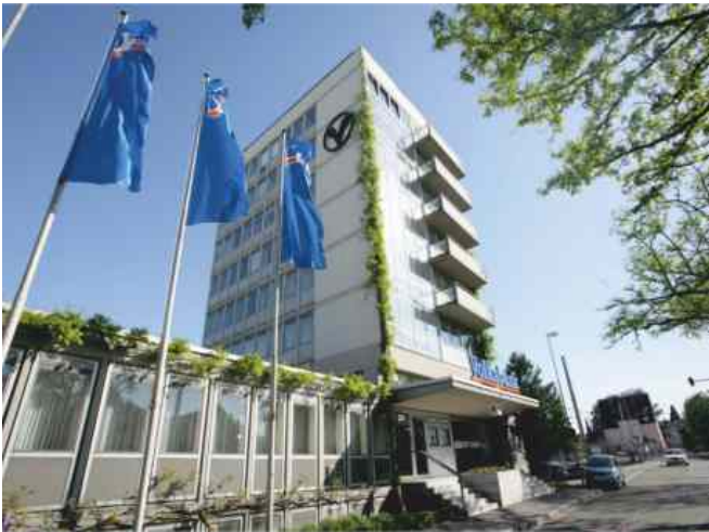
Blick auf das alte Volksbank-Gebäude, erbaut Anfang der sechziger Jahre des vorigen Jahrhunderts.