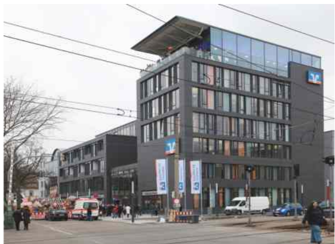
Das neue Volksbank-Gebäude Aufgenommen am Tag der offenen Tür am 19. Februar 2011