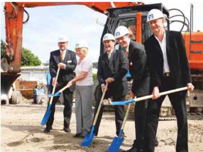
Spatenstich am 10. Juni 2009