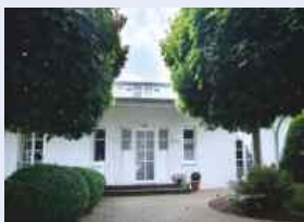
Premium Immobilie Ettlingen-Schluttenbach , Wfl. 323 m 2 , Bj. 1994, Grundstück 987 m 2 , 1 Garage/ 1 Carport, nach Absprache frei, € 890.000,--