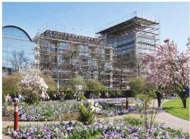
Der Volksbank-Neubau im Frühjahr 2010 noch im Rohbau-Zustand