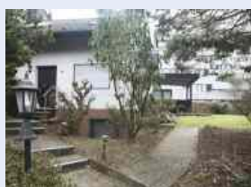
Waldbronn-Reichenbach Familienfreundliche Doppelhaushälfte , ruhige, sonnige Lage, Wfl. 176 m 2 , sofort frei, Gs 419 m 2 , € 315.000,--