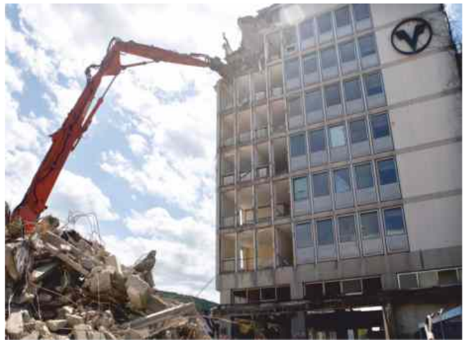
Start der Abrissarbeiten im April 2009