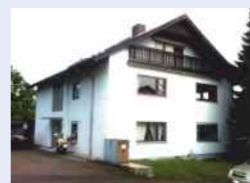
Waldbronn-Reichenbach schönstes Wohnambiente , 3 Zimmer-ETW, Wfl. 78 m 2 im DG, Bj. 1973, Tageslichtbad, 2 Balkone, Stellplatz im Freien, sofort frei, € 130.000,--