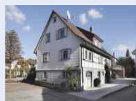
Karlsbad-Langensteinbach Freistehendes Fachwerkhaus , moderne Innenausstattung, große teilweise überdachte Terrasse, Wfl. 172 m 2 , € 195.000,--