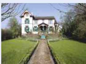
Premium Immobilie Ettlingen-Stadt , hochwertig sanierte Altbauvilla, Wfl. 250 m 2 , Garten mit altem Baumbestand, Gs 1.034 m 2 , € 1.500.000,--