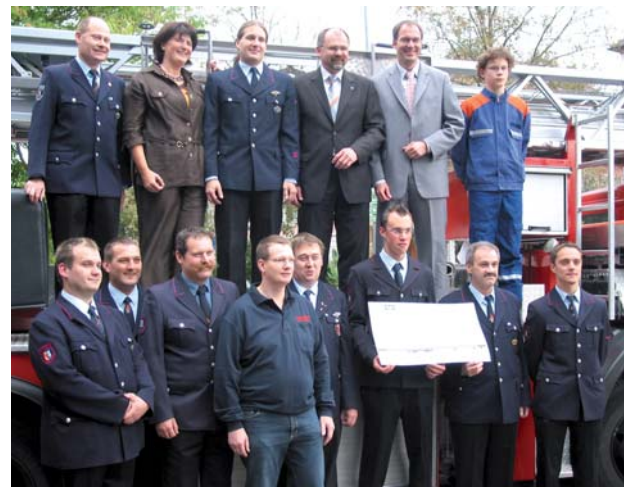
Spendenübergabe an die Jugendfeuerwehren im Albgau, September 2007

So haben wir uns im Jahr 2007 weit über das Thema Finanzen hinaus engagiert. Wir unterstützen finanziell und materiell Vereine und Institutionen im sozialen Bereich sowie Sponsoring-Projekte in Kultur und Sport – insbesondere für die Jugend. Das verstehen wir unter Verwurzelung mit der Region – eben „... typisch Volksbank Ettlingen eG“.